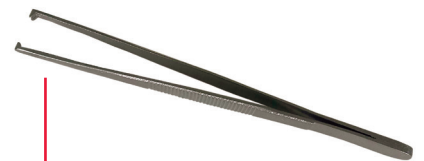
Pince anatomique 14cm avec griffes