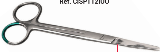
Ciseaux de Mayo

Les bouts pointus permettent de passer facilement sous un pansement ou sous un fil pour une meilleure préhension