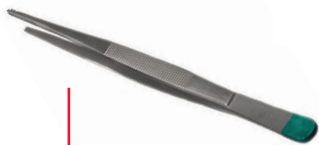
Pince de Adson 12cm sans griffe