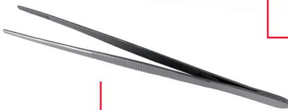
Pince anatomique 14cm sans griffe