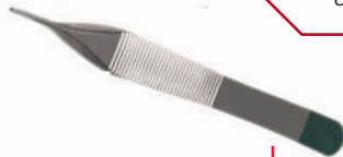
Pince de Adson