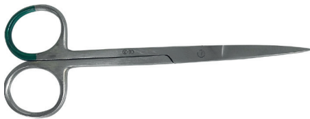
Ciseaux pointus type Iris