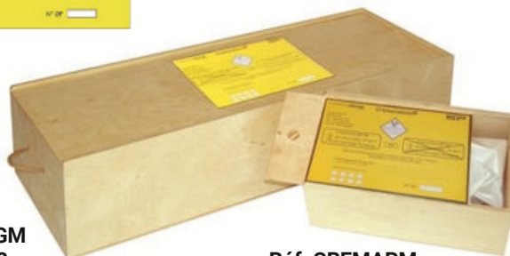
Réf. CREMAGM 975x355x222mm