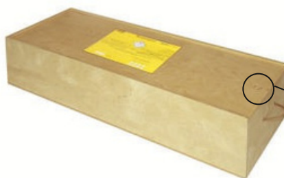
Fermeture définitive de la boîte par un tourillon en bois

⚠ Ces emballages ne doivent pas contenir de matières répondant au code UN2814 et 2900