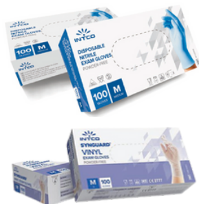
Réf. GNSYN...NP NITRILE