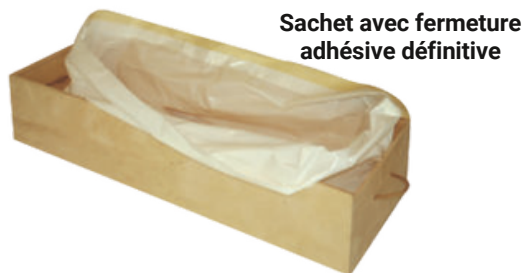
Sachet avec fermeture adhésive définitive