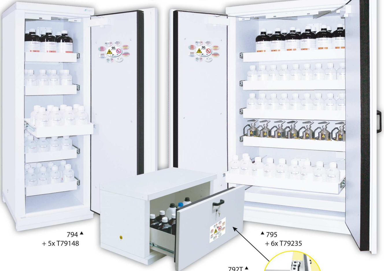
794 ▲ + 5x T79148