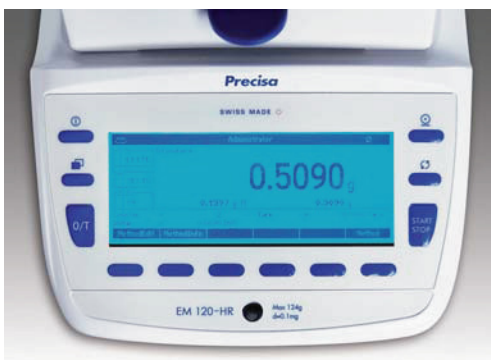
Large écran graphie LCD