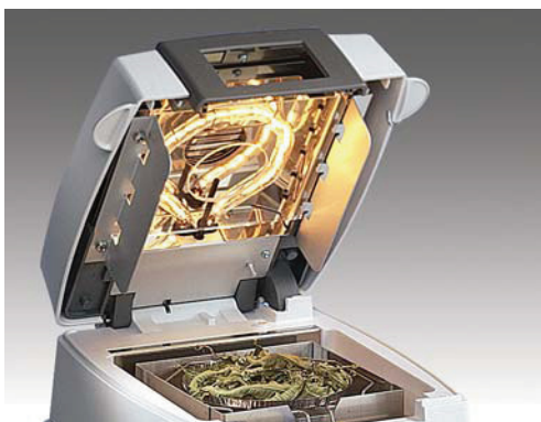
3 différentes sources de chaleur en option