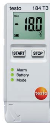
testo 184 T3