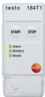
testo 184 T1

Aperçu des enregistreurs de données testo 184 .