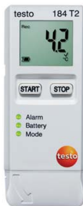
testo 184 T2