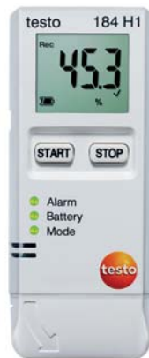
testo 184 H1