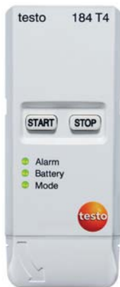
testo 184 T4