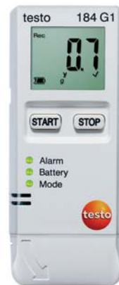
testo 184 G1