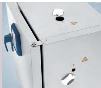
Port d'accès, face supérieure et côté droit

Contactez Thermo Fisher Scientific pour obtenir des renseignements sur nos solutions spéciales. Nous pouvons proposer les étuves de paillasse Heratherm pour des applications d'essai de câbles, des applications en salle blanche et des applications de gaz inerte avec enceinte intérieure étanche au gaz. Nous pouvons proposer des ports d'accès supplémentaires pour les étuves de grande capacité à l'emplacement souhaité, sur demande.