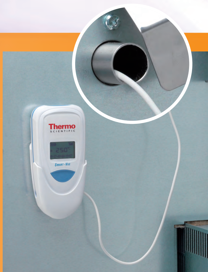
Vue arrière de l'étuve Advanced Protocol 100 L avec Smart-View

Les solutions varient selon les régions RF dans le monde entier et sont compatibles avec de nombreux types et marques d'équipements de laboratoire. Contactez votre représentant local pour de plus amples détails.