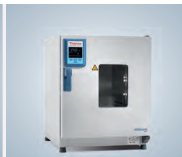
Fenêtre d'observation les appareil de 100 L