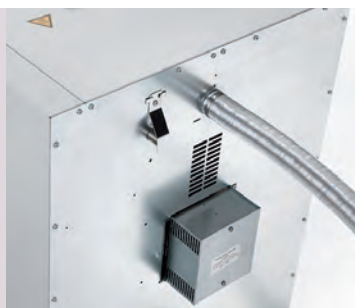
Kit d'installation sous paillasse