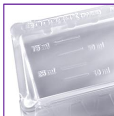
Graduation bien marquée