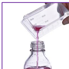
Transvasement du liquide