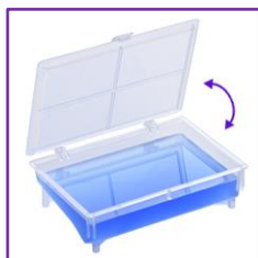
Couvercle avec fermeture