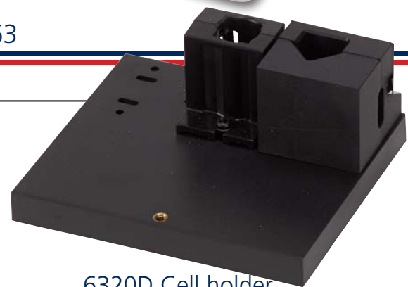
6320D Cell holder