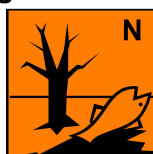
Dangereux pour l'environnement