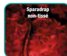
Analyse comparative de la quantité de cellules arrachées et poils tirés lors du retrait du sparadrap.