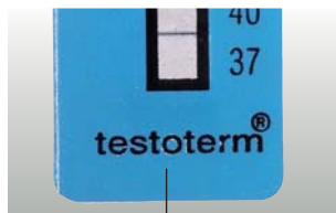
Votre logo/société sur demande (10 000 unités)